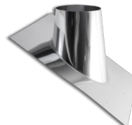
19. Střešní oplechování vč. manžety