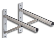
07. Stěnová konzola profil 300-700 mm